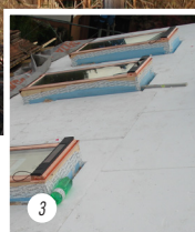
1 Innenliegende Solarkollektoren 2 Hinterlüftung der Kollektoren 3 Neue, dreifach verglaste Dachfenster