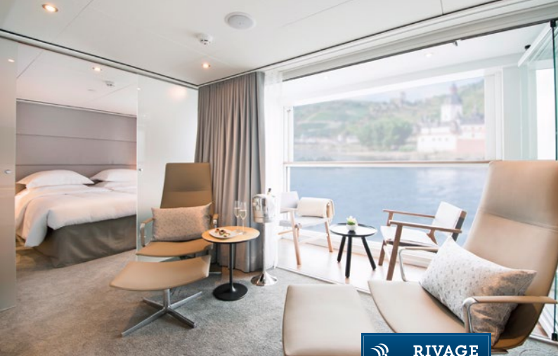
Suite eines Emerald Flussschiffs