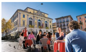
Genuss und Gemütlichkeit