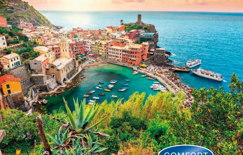
Cinque Terre, Italien