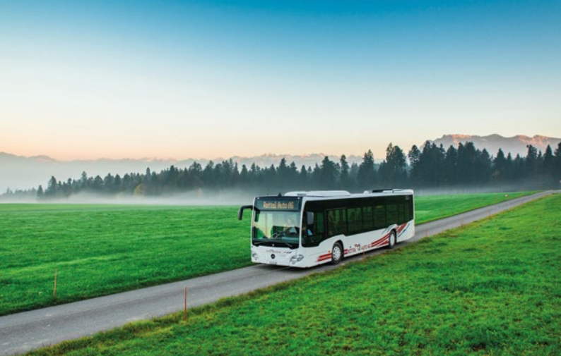
Linienbus der Rottal Auto AG