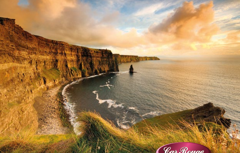
Cliffs of Moher, Irland