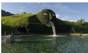
Kultur und Wissen