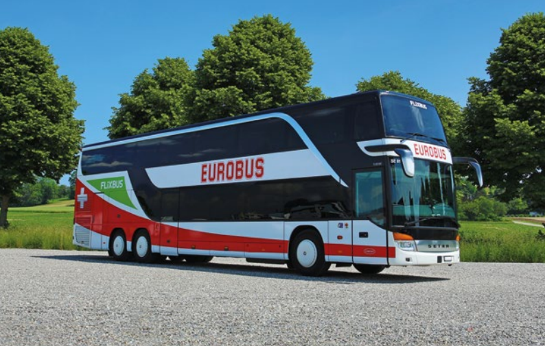
EUROBUS swiss-express Fernbus