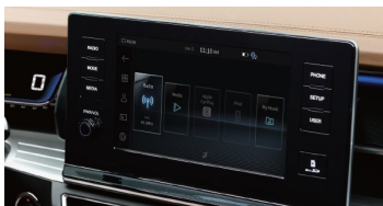
9" LCD (1280*720) mit Rückfahrkamera

* Metallic-Farben im Preis enthalten bei der 1st Edition.