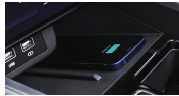
Wireless-Ladestation für das Mobiltelefon