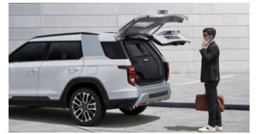
Elektrische Hecklappe mit Komfort-Funktion

Unverbindliche Preisempfehlung inkl. 7.7% MwSt.