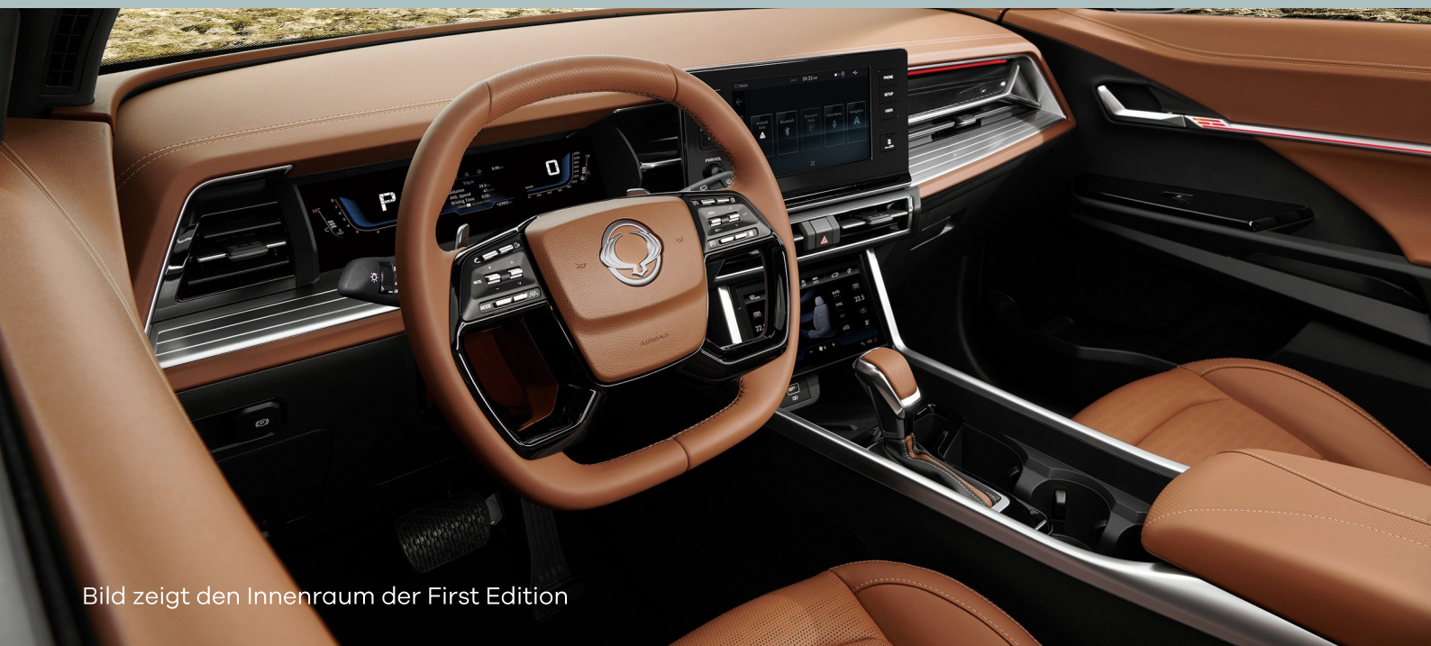
Bild zeigt den Innenraum der First Edition

Der Torres bietet mehr als Sie erwarten!